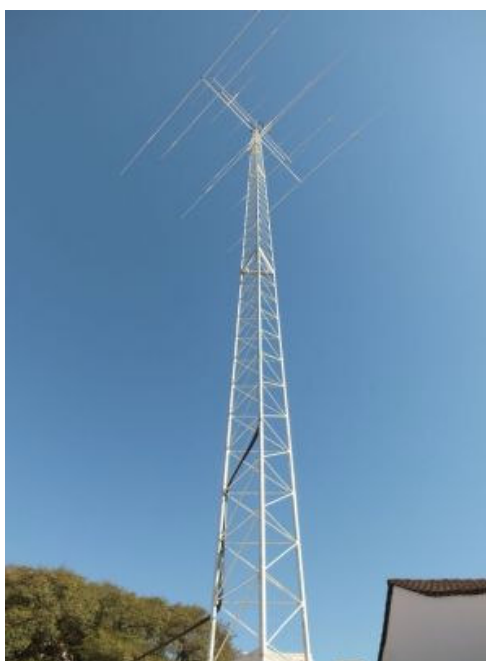
Foto da nova torre e antenas da PY2AA

A sede da LABRE/SP passou por uma grande reforma. A sala de aula foi recondicionada. Antigas salas foram transformadas em áreas para reuniões e trabalho da diretoria. A sala de Bureau de QSLs foi modernizada, a antiga biblioteca se transformou num auditório completo, que também pode funcionar como uma sala de aula. A área da secretaria ficou mais espaçosa. A sala dedicada ao museu foi toda reformulada e também serve de apoio para a nova estação PY2AA. Uma nova torre autoportante e novas antenas direcionais foram adquiridas para HF e VHF. Um novo sistema de segurança predial também foi instalado.